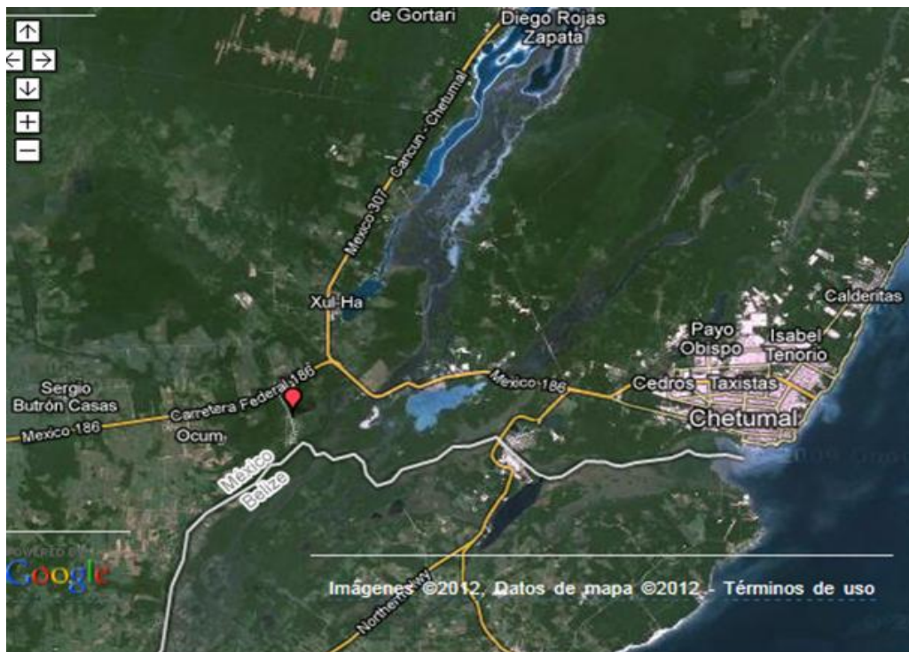
Figura 1. Mapa de localización del ejido Juan Sarabia

Esta comunidad de Juan Sarabia se encuentra ubicada al sur del Estado mexicano de Quintana Roo, específicamente en el municipio de Othón P. Blanco, su ubicación geográfica en coordenadas son; Latitud: 18.4833 Longitud: -88.4833. La altitud media del poblado de Juan Sarabia es de 15 metros sobre el nivel del mar. (msnm).